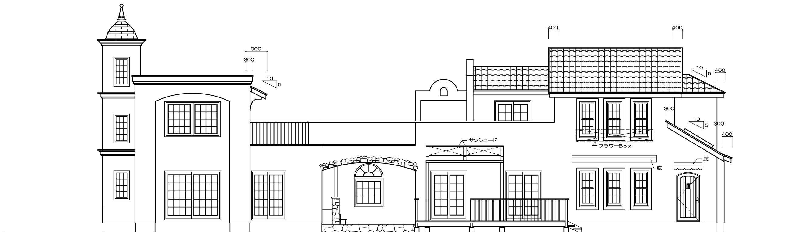
東立面図 S: 1/100